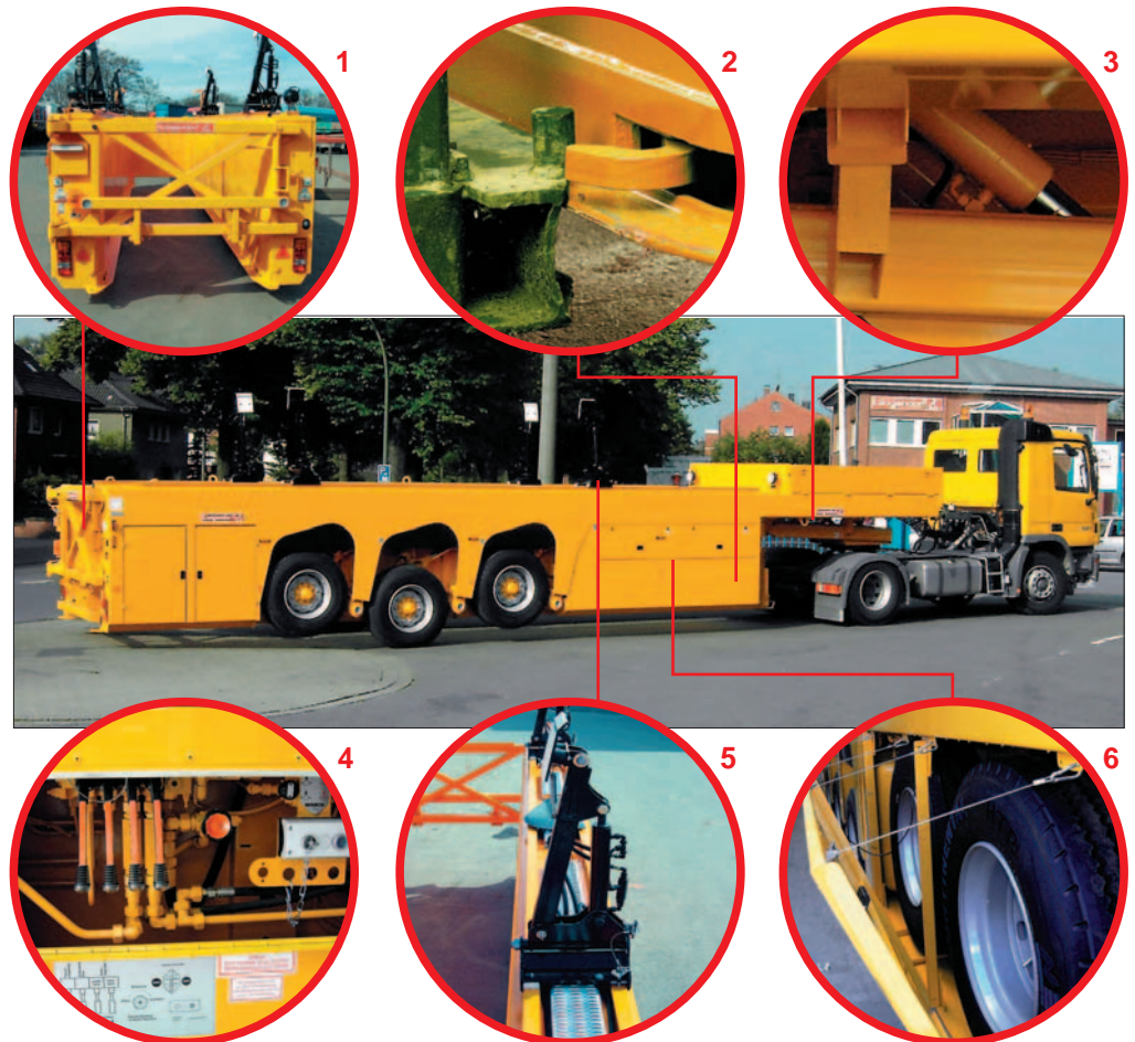
Bild 6 Ersatzradhalter